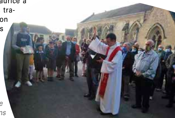
L'équipe des Doucéens

Le Cercle Saint-Maurice a pris en charge les travaux de restauration et aujourd'hui nous avons une belle salle... que nous partageons en toute amitié pour les activités de la paroisse et du Cercle.