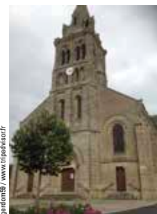
patrimoine81 / www.tigne.fr

C'est l'équipe liturgique qui fleurit et balaie si nécessaire. Lors des grands ménages, 7/8 personnes participent dont 2 hommes.